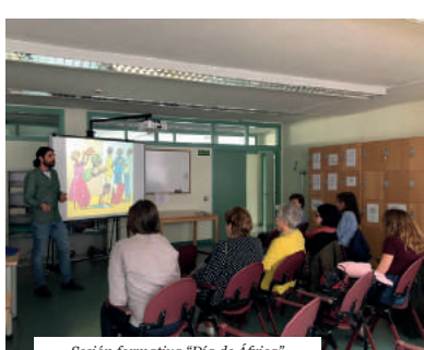
Sesión formativa "Día de África"

En mayo y junio presentamos la justificación de los proyectos de Cooperación y Educación desarrollados en el 2018.