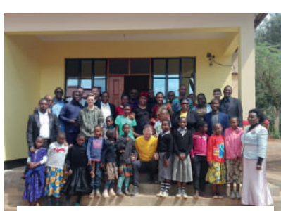
Inauguración del centro de niñas en Mwema Children