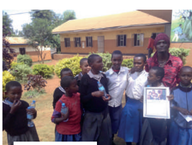
Equipo Mtoto Wa Kike